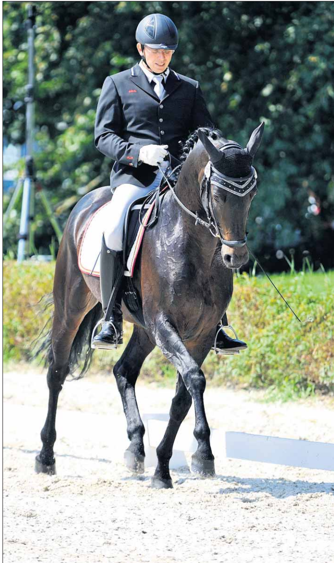
Eleganz, Anmut: Dressurreiten ist die Königsdisziplin der Reiter. Einen Eindruck davon gibt's beim Tübinger Reitturnier.