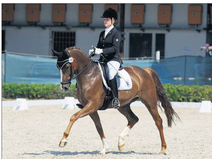
Hochkarätige Dressurprüfungen stehen auch im picken vollen Terminkalender.

Pferde, Reiter, Sprünge, Piaffen und Piouretten und nicht zu vergessen, das gemütliche Beieinandersein: darum dreht sich vom 29. Juni bis 1. Juli beim Großen Reit- und Springturnier der Tübinger Reitgesellschaft (TRG) an der Waldhäuser Straße alles. Die Landesspitze aus Baden-Württemberg reitet in zehn Dressur- und 21 Springprüfungen um Preisgelder in Höhe von 35 000 Euro. Höhepunkt ist der Große Preis von Tübingen, der am Sonntagmittag ausgetragen wird.